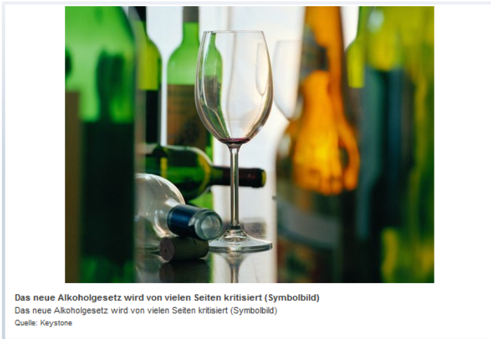
Das neue Alkoholgesetz wird von vielen Seiten kritisiert (Symbolbild)

Ein Infoanlass zeigt: Bei häuslicher Gewalt spielt Alkohol eine grosse Rolle. von Samuel Weissman